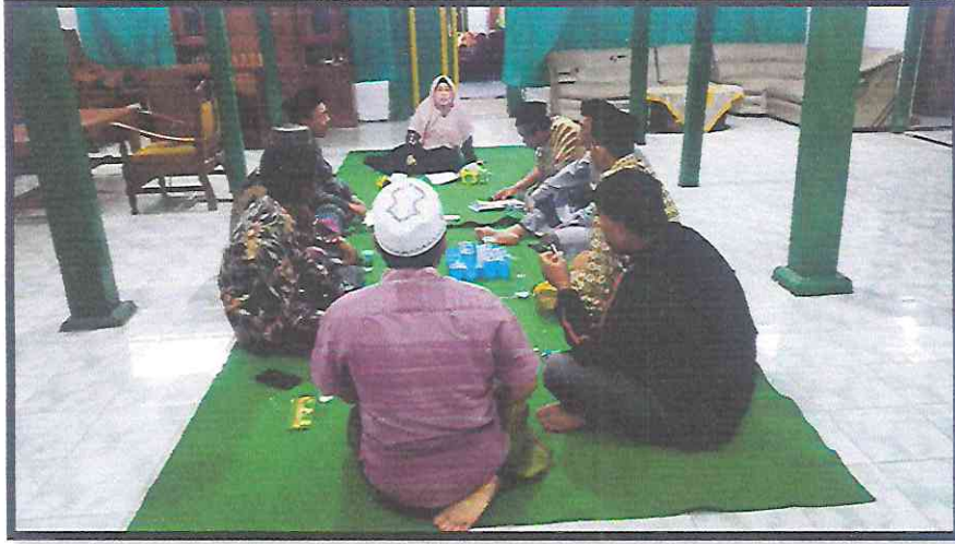
FOTO KEGIATAN MUSYAWARAH DESA PEMANFAATAN ASET DESA TAHUN 2024