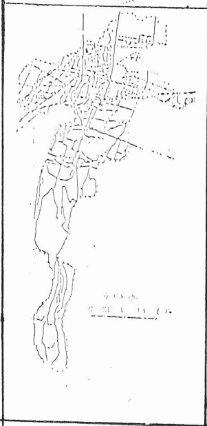
PETA KECAMATAN LOCERET KABUPATEN NGANJUK